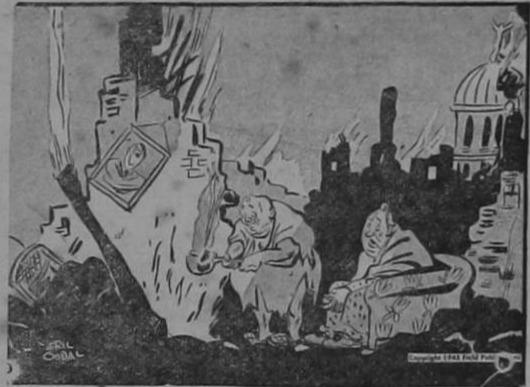
“Pero si el fuehrer nos prometió que solamente los ingleses tendrían que comer a la intemperie.”

Y por la noche, cuando los periódicos den la noticia de la derrota del cortesismo, hay que rezar por el descanso del alma de don León Cortés.