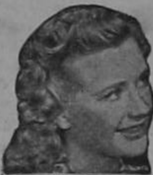
Priscilla Lane de la Warner Bros.

LA cara, los brazos y las manos adquieren un aspecto fresco y encantador aplicando Crema Primavera antes de empolvarse. Véalo en su espejo. El cutis marchito y macilento se esfuma y aparece la piel rosada y transparente que es tan atractiva y tan admirada.