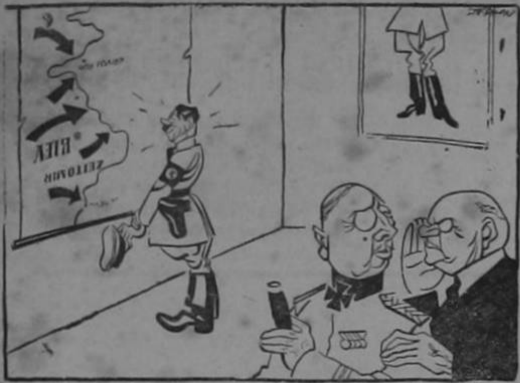
“...Ssssh! Hemos vuelto el mapa al revés para que se crea que estamos avanzando...”